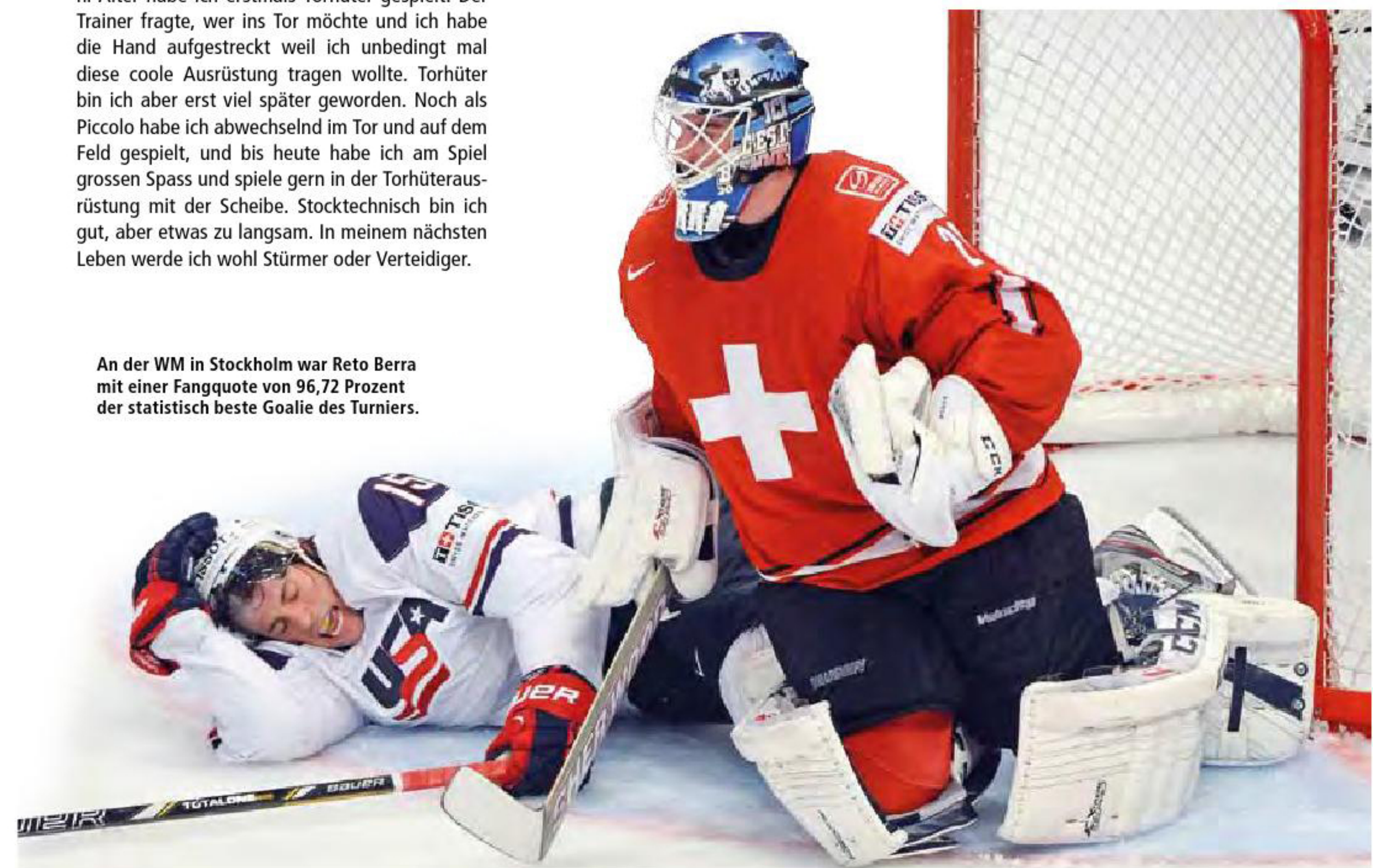
An der WM in Stockholm war Reto Berra mit einer Fangquote von 96,72 Prozent der statistisch beste Goalie des Turniers.

So ungefähr. Zuerst war ich Feldspieler. Im Bambini-Alter habe ich erstmals Torhüter gespielt. Der Trainer fragte, wer ins Tor möchte und ich habe die Hand aufgestreckt weil ich unbedingt mal diese coole Ausrüstung tragen wollte. Torhüter bin ich aber erst viel später geworden. Noch als Piccolo habe ich abwechselnd im Tor und auf dem Feld gespielt, und bis heute habe ich am Spiel grossen Spass und spiele gern in der Torhüterausrüstung mit der Scheibe. Stocktechnisch bin ich gut, aber etwas zu langsam. In meinem nächsten Leben werde ich wohl Stürmer oder Verteidiger.